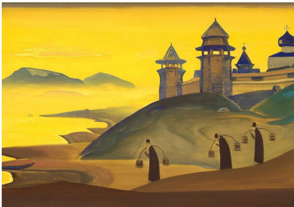
И мы трудимся