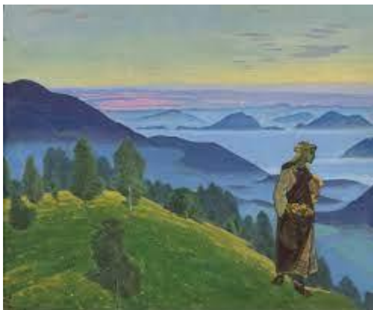
Путь на Кайлас